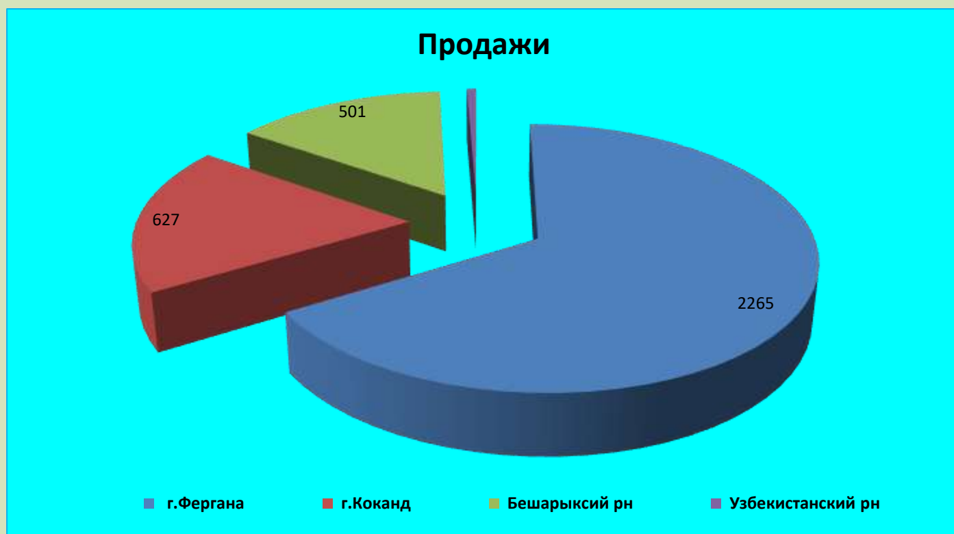
Число проданных туров по регионам за 2017 год