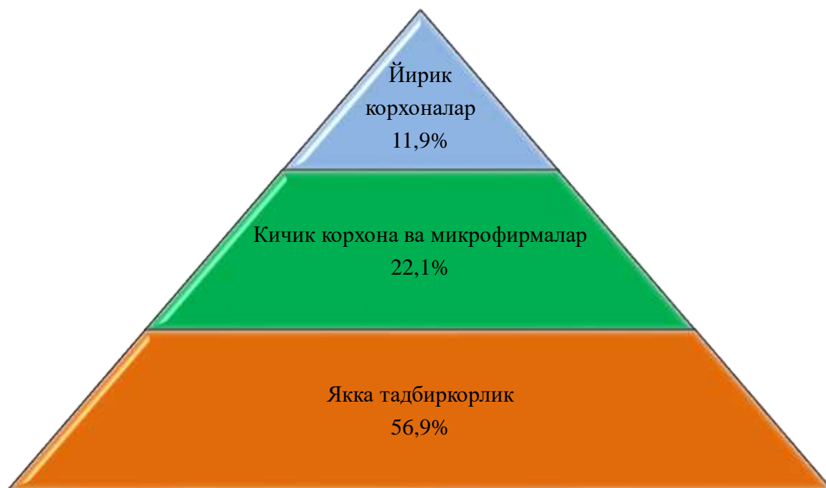
Чакана савдо товар айланмаси таркиби (2019 йилнинг январь–сентябрь ҳолатига фоизда, уюлмаган савдосиз)

2019 йилнинг январь–сентябрда чакана савдо товар айланмаси таркиби давлат ва нодавлат шакллари бўйича қуйидагича ифодаланади: нодавлат сектор мулки 6 112,5 млрд.сўмни ёки ўтган 2018 йилнинг шу даврига нисбатан 104,8 фоизни ва умумий чакана савдо товар айланмасидаги улуши 100,0 фоизни ташкил қилди.