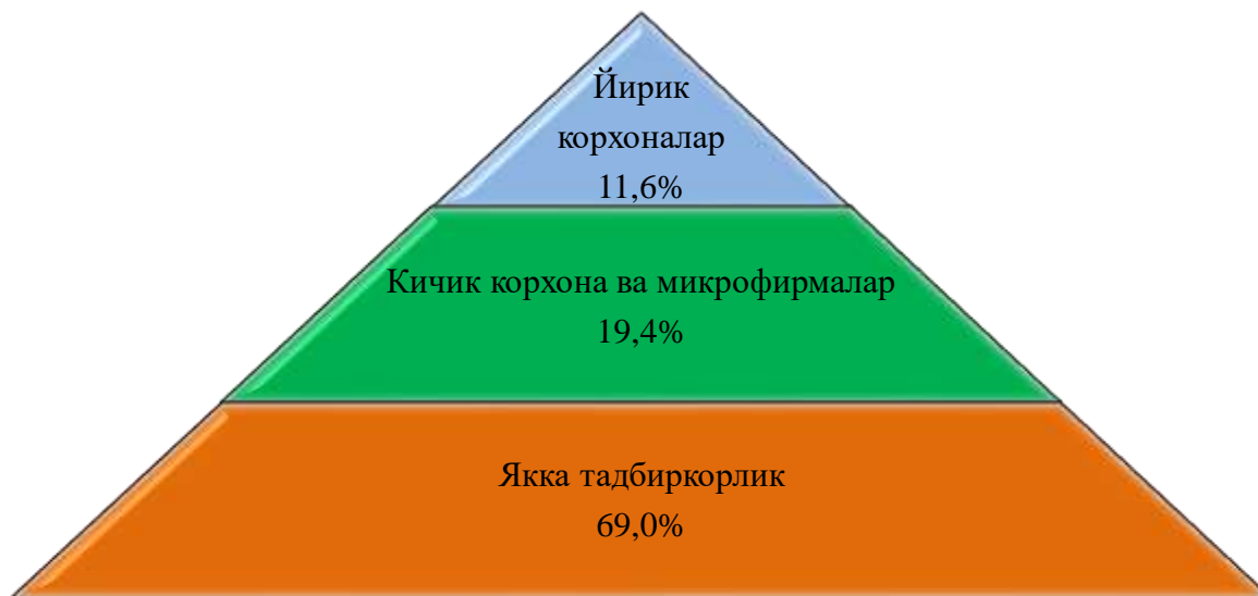
Чакана савдо товар айланмаси таркиби (2019 йилнинг январь–декабрь ҳолатига фоизда, уюшмаган савдосиз)

2019 йилнинг январь–декабрида чакана савдо товар айланмаси таркиби давлат ва нодавлат шакллари бўйича қуйидагича ифодаланади: нодавлат сектор мулки 13 515,0 млрд.сўмни ёки ўтган 2018 йилнинг шу даврига нисбатан 105,0 фоизни ва умумий чакана савдо товар айланмасидаги улуши 100,0 фоизни ташкил қилди.